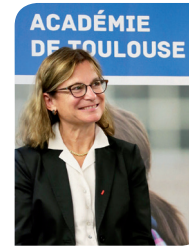
Anne Bisagni-Faure, rectrice de l'académie de Toulouse, chancelière des Universités